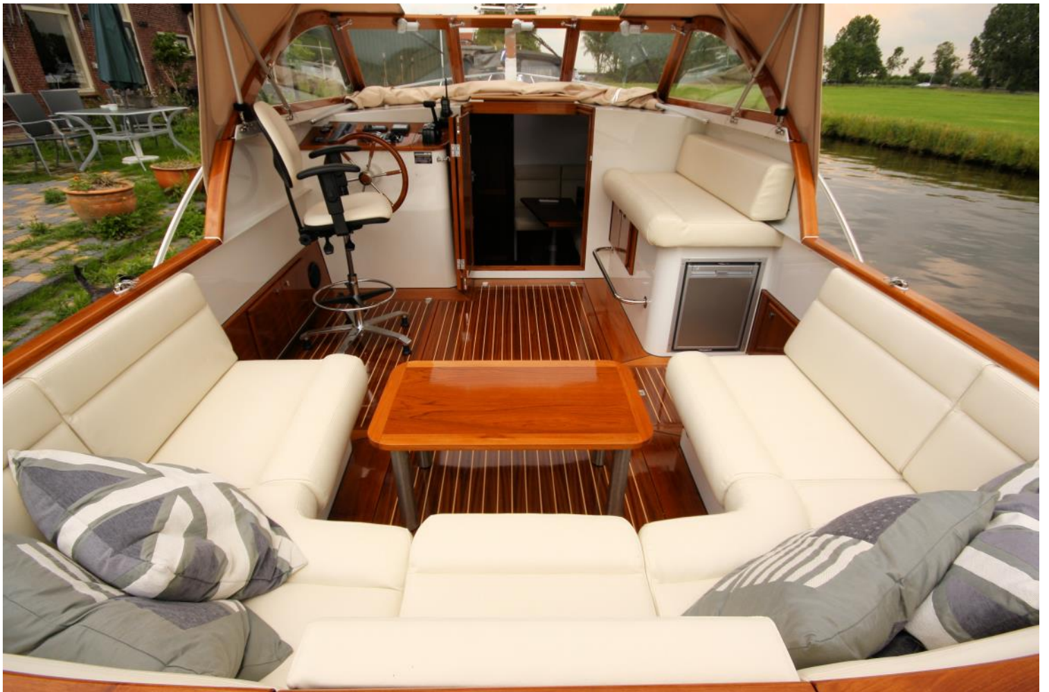
Corona C102 met teakhouten stuurhuisramen