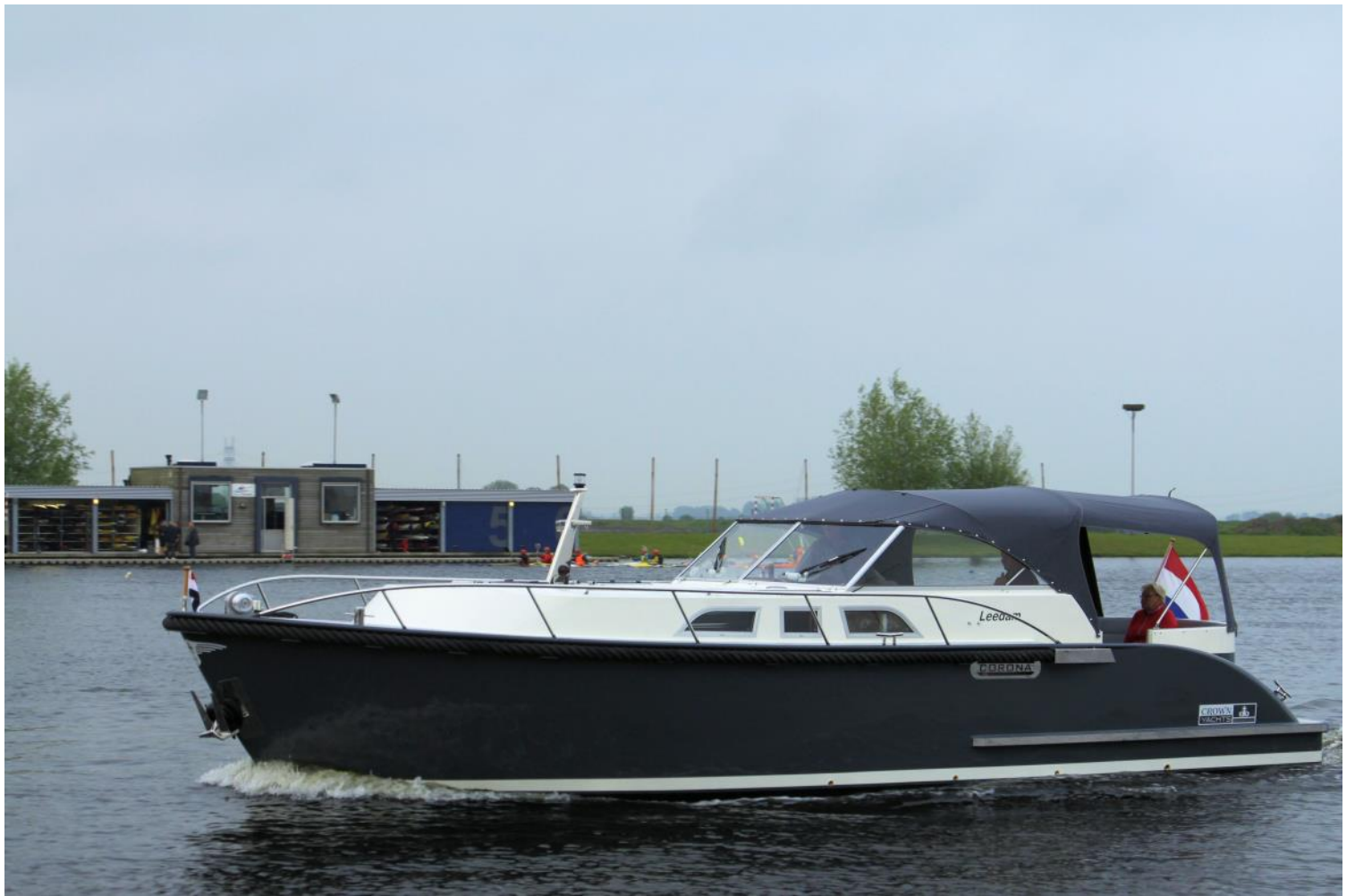
Corona C102 met grote ramen en klappbare aluminium stuurhuisramen