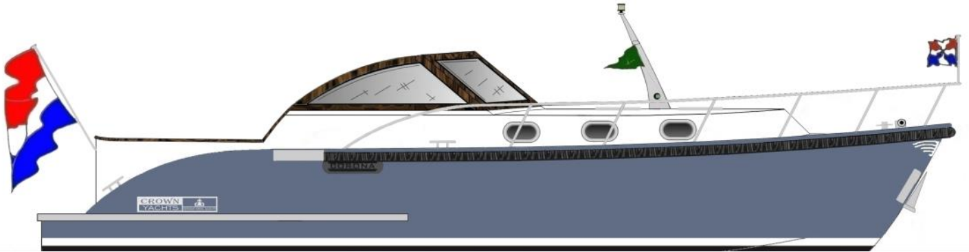
Corona C103 met poorten en teakhouten stuurhuisramen