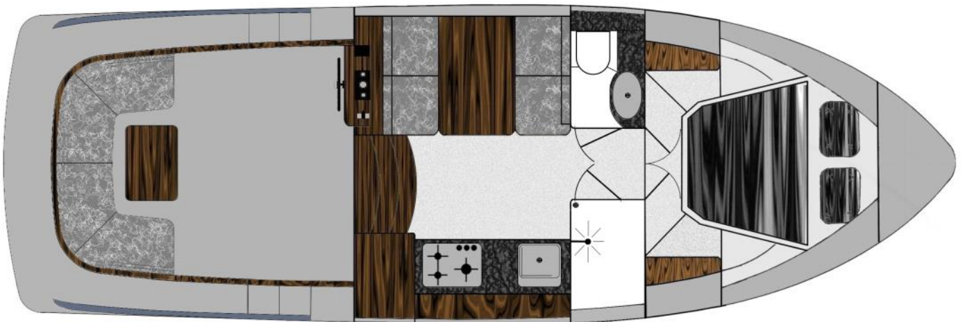
Interieur optie 1 Corona C103