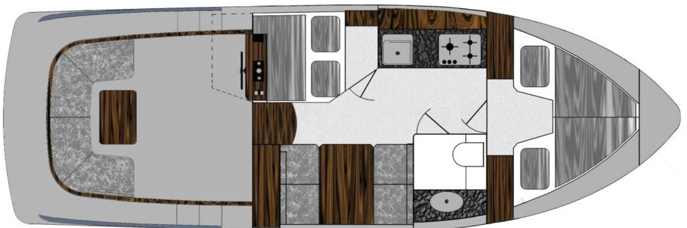
Interieur optie 2 Corona C103